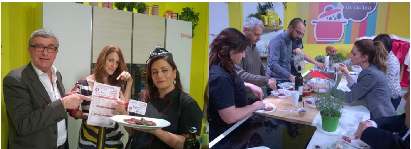
IL BACKSTAGE DELLA TRASMISSIONE CON LO STAFF CHE ASSAGGIA LA TAGLIATA "QUALITA' VERIFICATA"!!

Programmazione: n. 3 puntate a settimana (Lunedì - Martedì - Mercoledì) + n. 3 repliche (Giovedì - Venerdì - Sabato)