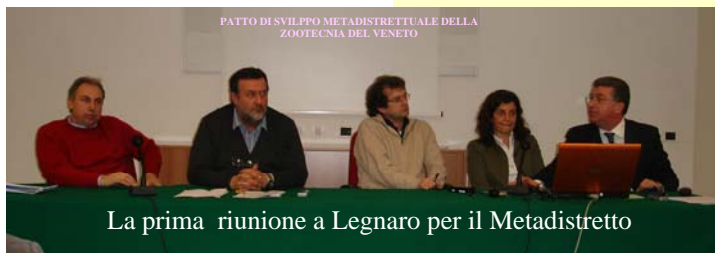
La prima riunione a Legnaro per il Metadistretto